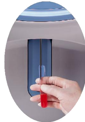
Step 2 Fully automatic aspiration and dilution procedures