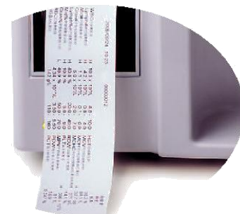
Step 4 Programmable multi-format printout